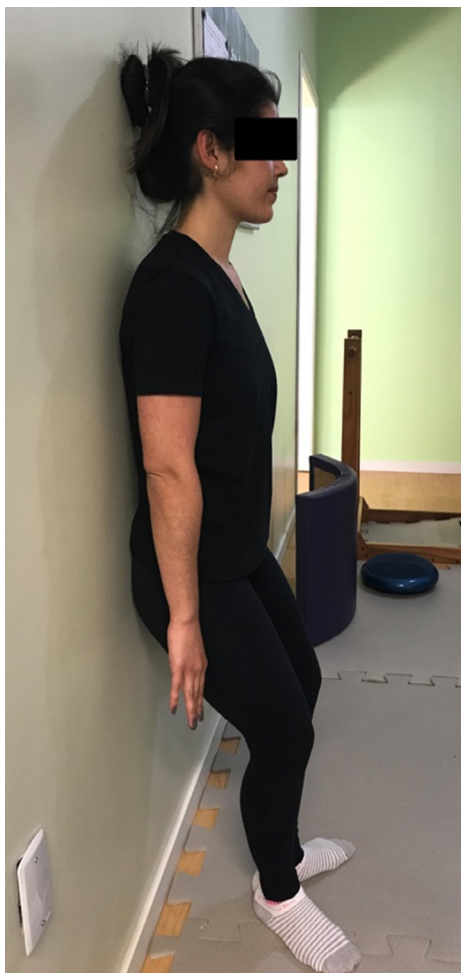
Figura 2 - The wall - Posição inicial.

O flexicurva é uma régua emborrachada sem escala, com alma interna de chumbo com liga especial, e com 80 cm de comprimento. Essa régua permite flexibilidade e funcionalidade para a confecção de moldes de curvaturas, de modo que quando o flexicurva é moldado na coluna vertebral, replica as curvaturas da região dorsal e lombar da pessoa.