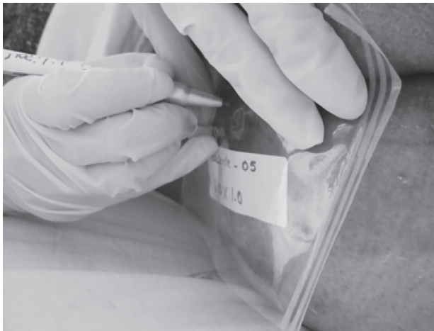
Figura 1 – Delimitação do contorno da área da úlcera no acetato

Após o registro no papel vegetal foi determinada a área total da úlcera: 1) sobreposição do papel vegetal em papel milimetrado (21), efetuando-se a contagem da quantidade de quadrados dentro da área da úlcera para determinar o valor de sua área em milímetros quadrados ( \text{mm}^2 ); 2) digitalização das imagens obtidas no papel vegetal para mensuração através do programa Image J ® (22), comparadas com um referencial padrão com área conhecida (Figura 2).