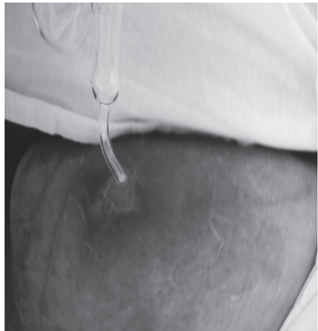
Figura 3 – Aplicação da microcorrente na úlcera

Para aplicação da alta frequência foi utilizado o equipamento Plus ® , da marca Tone Derm, que opera com corrente alternada. Utilizou-se a técnica de faiscamento (Figura 3), com amplitude a 80% e eletrodo do tipo bico, contornando toda a úlcera e o seu interior, afastado do tecido o suficiente para evitar o contato e a contaminação. Os sujeitos receberam dez aplicações diárias durante, no máximo, dez minutos, sendo variável com o tamanho da lesão (1 minuto para cada \text{cm}^2 ), totalizando duas semanas de intervenção.