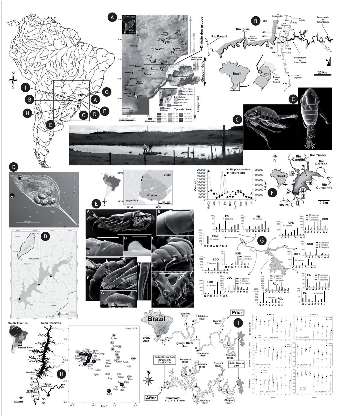
Figura 1- A. Tendências dos últimos 60 anos dos temas geralmente abordados para o estudo do zooplâncton; B. Mapeamento de áreas-alvo (em cinza) que necessitam de mais estudos no continente