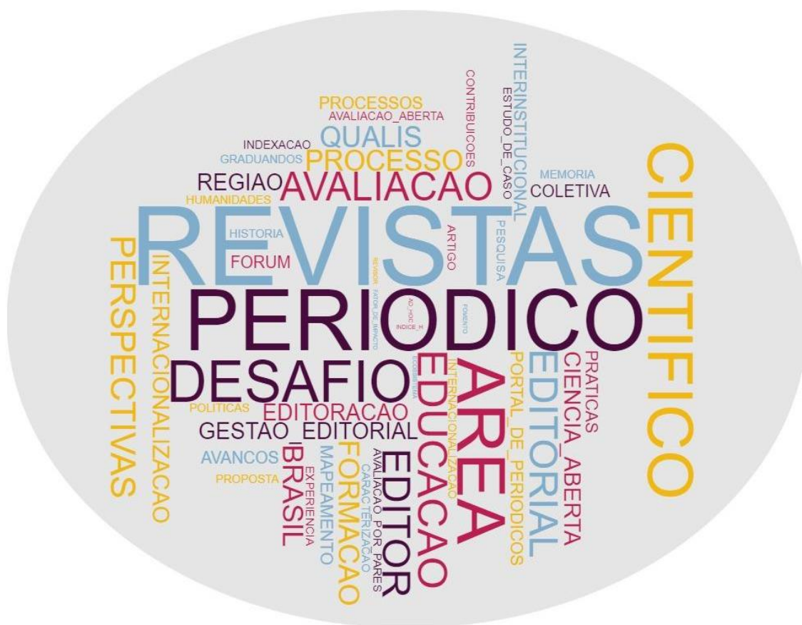
Figura 1 – Nuvem de palavras construída a partir dos trabalhos apresentados no CONEPed