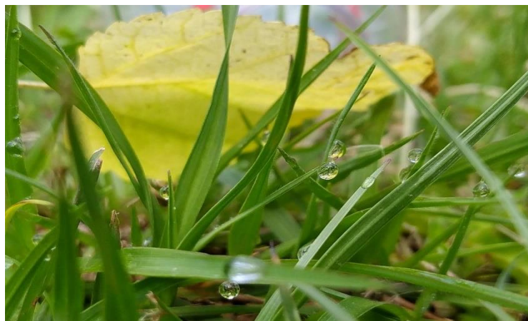
Figura 2 – Esferas de orvalho da manhã

Duas imagens, dentre várias, chamaram a atenção de Silva. A primeira delas, uma surpresa, em que o estudante percebe a Geometria em gotas de orvalho da manhã.