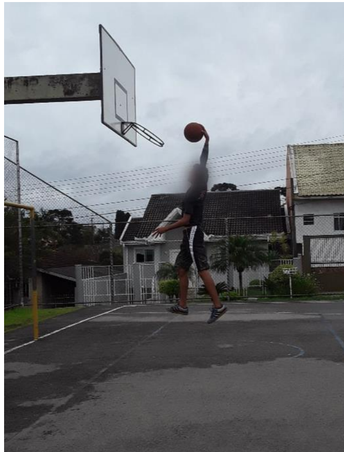
Figura 3 – O movimento é geométrico

movimento geométrico, tendo em vista que o corpo ocupa lugar no espaço, portanto, qualquer movimento é deslocamento de formas. De modo análogo, os estudantes perceberam a velocidade e aceleração como sendo de natureza geométrica, afinal, é o movimento dessas formas no espaço e no tempo que constitui a velocidade de um atleta para a realização dos pontos. Tudo é geométrico. O movimento é geométrico. Em resumo, eles conseguiram relacionar os movimentos e o espaço como geométrico, alegando que a geometria está presente em cada detalhe do corpo em movimento.