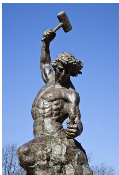
Figura 1 – O homem esculpindo a si mesmo