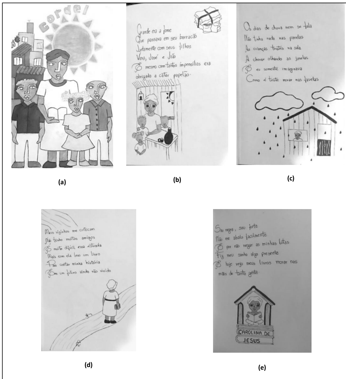
Figura 2 – Cordel “Minhas lutas”