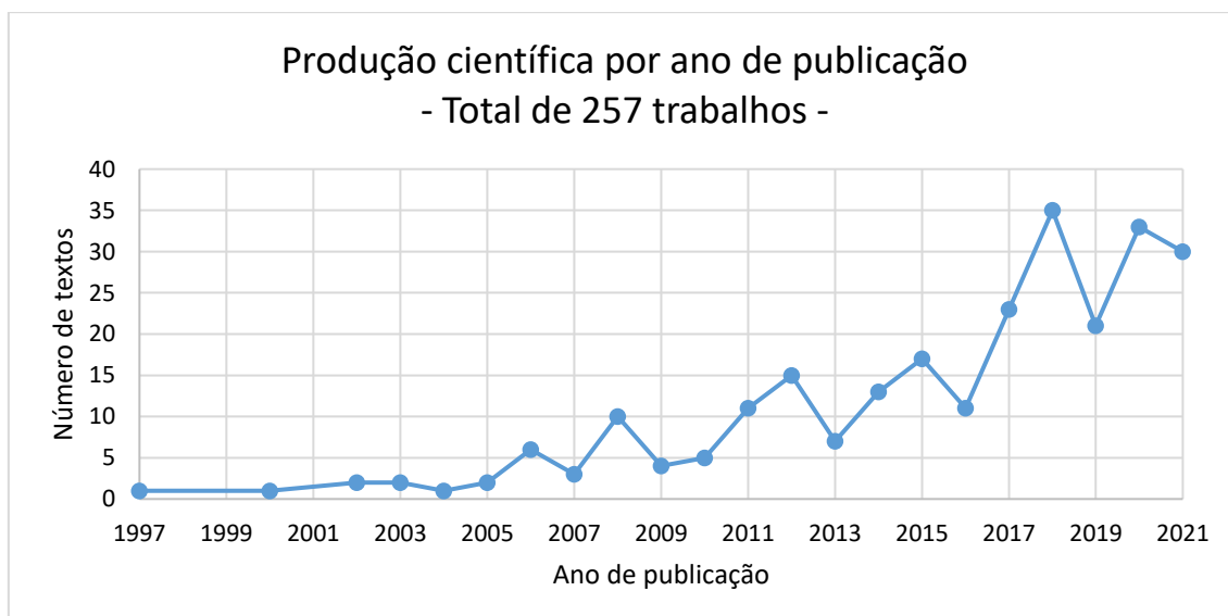
Gráfico 1 – Produção científica sobre a relação educação/escola/currículo com cidade/território por ano de publicação

Outro aspecto que chama a atenção é a progressiva ampliação do volume de produção relacionado ao tema em pauta ao longo dos últimos 20 anos, que, pelo mapeamento, já alcança um total de 257 trabalhos. No gráfico a seguir, mostraremos um panorama geral da produção com destaque para sua série histórica. Note-se que a partir de 2016 ocorre um aumento ainda mais significativo no número de textos, acréscimo este cujas razões não foram identificadas nesta fase do trabalho, mas que podem ser exploradas em outro momento.