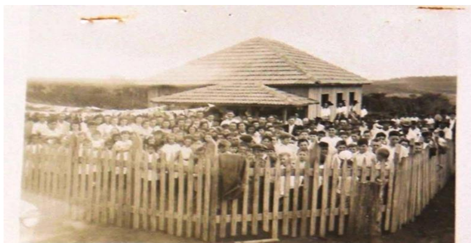
Figura 3 – Escola Isolada de Mandaguaçu