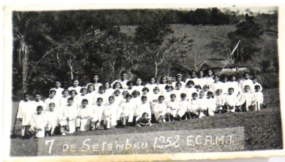
Figura 8 – Escola Arrolada após o ofício de Pato Branco