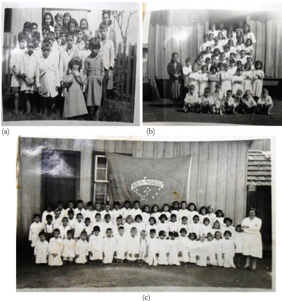
Figura 6 – Escola de Faxinal (a), escola de Faxinal (b) e escola de Faxinal (c), sem identificação

Fonte: Ratcheski (1953). Cem Anos de Ensino no Estado do Paraná.