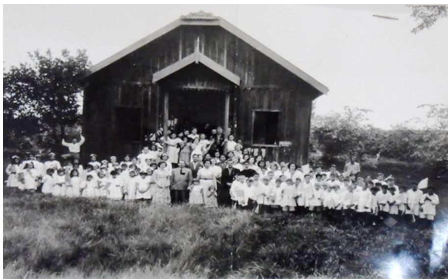
Figura 7 – Escola Concórdia