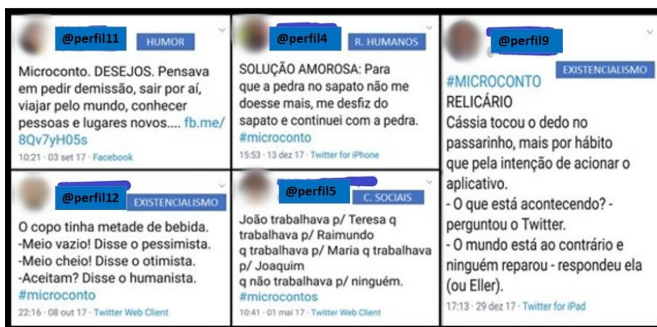
Figura 1 - Categorias temáticas mais recorrentes