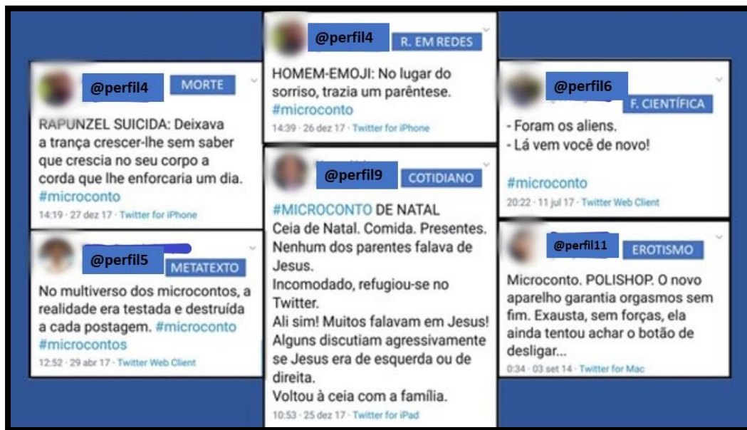
Figura 2 - Demais categorias temáticas