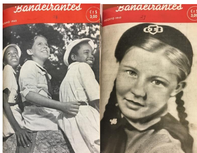
Figura 3 – Diversidade Étnica e de Classe Social no Movimento