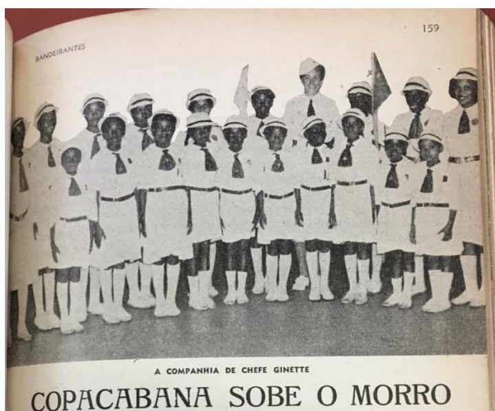
Figura 2 – O Bandeirantismo no Morro