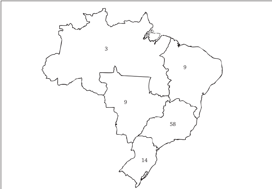
Figura 1 - Quantidade de produções distribuídas nas cinco regiões do país