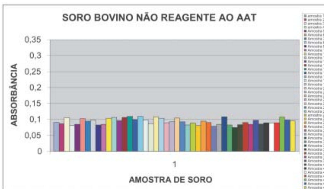
FIGURA 3 - Valores de absorbância de soros bovinos não reagentes ao Teste ELISA indireto Figure 3 - Values of absorbance of bovine serum not reacting to the indirect ELISA test