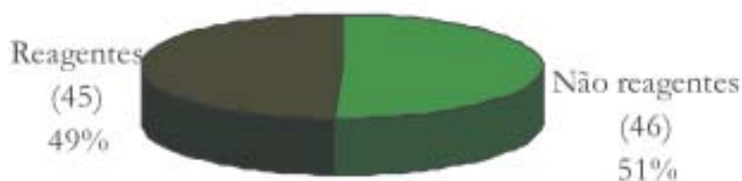
FIGURA 1 - Amostras de soro bovino submetidos ao teste do AAT Figure 1 - Samples of bovine serum subjected to the test of the AAT

Das 91 amostras analisadas neste experimento todas foram submetidas ao teste do Antígeno Acidificado Tamponado, no qual se obteve 46 amostras não reagentes e 45 reagentes, Figura 1.