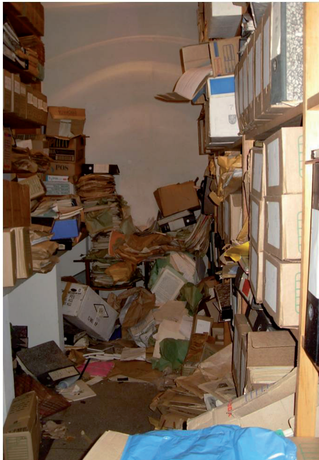
Figura 1 — Sala usada como depósito de documentos do Setor de Ciências Humanas