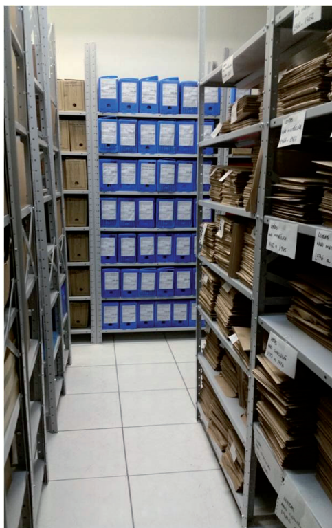
Figura 3 — Sala atual do Arquivo Permanente e Intermediário do Setor de Ciências Humanas