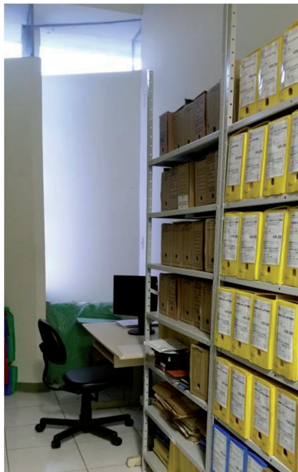
Figura 4 — Sala atual do Arquivo Permanente e Intermediário do Setor de Ciências Humanas da UFPR