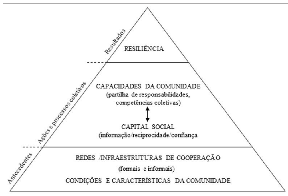
Figura 4 - Organização social e condições de mudança

Segundo a designação de organização social de Mancini & Roberto (2009), as condições interagem-se e características de uma comunidade com as redes e infraestruturas que facilitam a cooperação. Essas redes tanto podem ser de caráter formal como informal, mas todas potenciam mobilização. As relações familiares, o círculo de amigos, os espaços de sociabilidade associados aos lugares de trabalho são alguns exemplos de ligações que desenham redes. Redes que, de acordo com a respectiva densidade de ligações, criam padrões de resiliência nas respectivas comunidades. Muito do capital social é forjado nesse emaranhado de fluxos por onde circula informação, reciprocidade e confiança, e que, por sua vez, faz emergir um conjunto de recursos sociais. As capacidades de uma comunidade podem ser vistas no sentido de responsabilidade, no envolvimento coletivo, na partilha de crenças ou no perfilhar de objetivos que projetem qualidade de vida no longo prazo. Podem ainda traduzir competências para identificar oportunidades de restabelecimento do capital social perdido ou fazê-lo progredir, por oposição à concepção de ações reativas diante dos riscos. Esse padrão de comportamento manifesta-se no quotidiano e reafirma-se em situações ameaçadoras