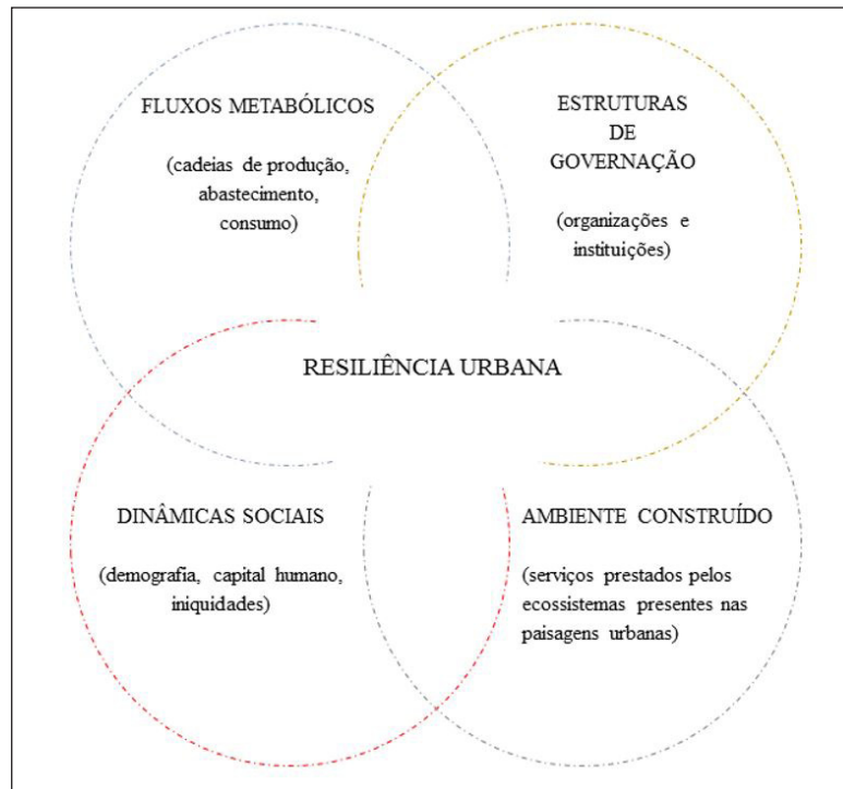
Figura 3 - Dimensões da resiliência urbana