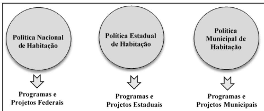
Figura 2 - Principais focos dos estudos