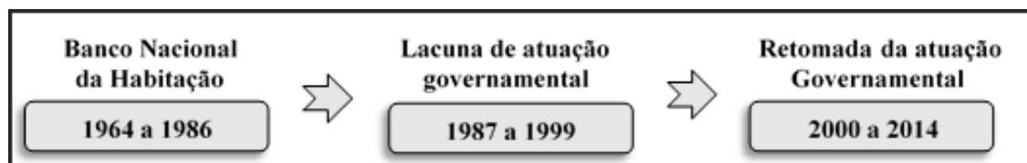
Figura 1 - Trajetória da atuação governamental na questão habitacional

O foco representa o principal assunto tratado no texto, podendo focar a Política Nacional de Habitação e/ou algum programa federal derivado, a política de habitação específica de algum Estado ou município, assim como determinado programa estadual ou municipal específico (Figura 2).