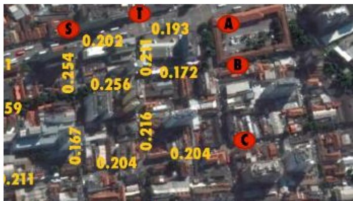
Figura 2 - Valores de IMTUCsegmento pertencentes às vias A,B, C e D.

Os valores do índice por segmento (IMTUCsegmento) obtidos para a região central de Niterói são baixos, variando entre 0,109 e 0,391. A Figura 2 apresenta os valores do índice por segmento (IMTUCsegmento) para as ruas A,B,C,D, R (até quadras 44 – 7), S (até quadras 7-8) e T (até quadras 8-9).