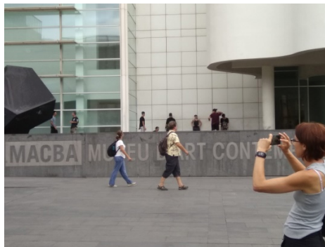
Figura 8 - Turistas.