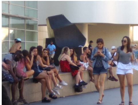
Figura 7 - Jóvenes.