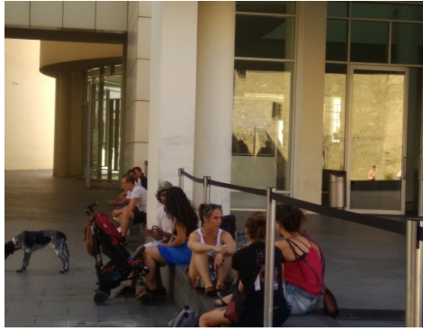
Figura 6 - Familias.