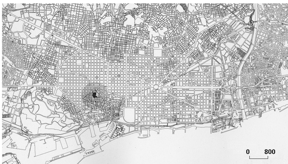
Figura 1 - Situación de la Plaça dels Àngels (en metros), escala original 1:40.000.

Al delinear su genealogía espacial, comprendemos que la Plaça dels Àngels es un espacio público y, al mismo tiempo, mucho más.