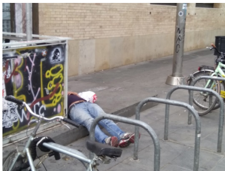
Figura 9 - Sintecho.