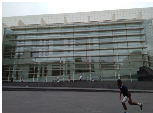
Figura 4 - MACBA.