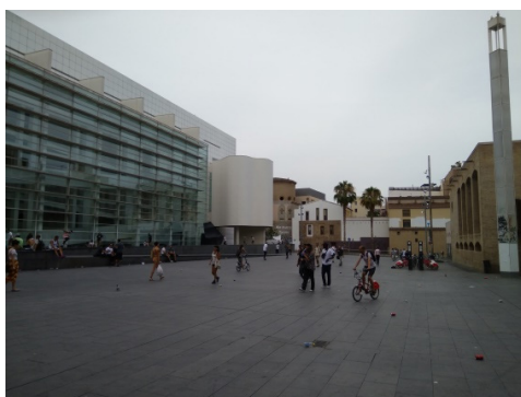
Figura 5 - Flujo constante.