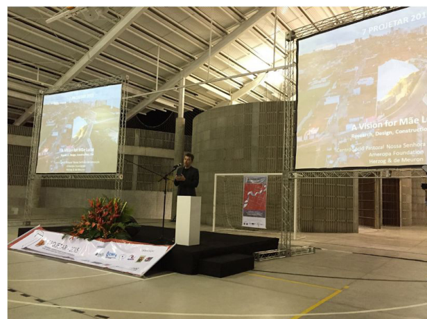
Figura 3 - Arena do Morro (palestra de Tomislav Dushanov no VII Projetar)

A inauguração [...] é o passo inicial de uma proposta urbana que pretende prover a comunidade de espaços coletivos de recreação, esporte, cultura e educação. o equipamento é o centro de um eixo previsto para atravessar o bairro na