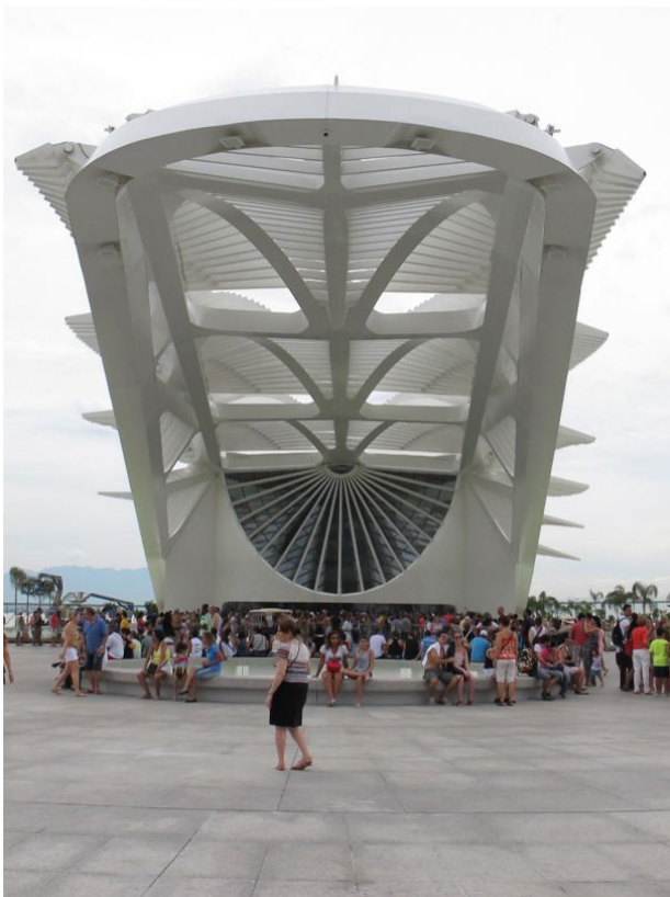
Figura 7 - Museu do Amanhã (na "boca do crocodilo")

Ao retornar à Praça Mauá me deparo com a vista do Morro e Mosteiro de São Bento e dos edifícios do Arsenal de Marinha maculada por um aglomerado de edifícios que lembram "verrugas urbanas" [Figura 9]. No trajeto imaginei o desconforto das pessoas que formam as filas intermináveis sobre pisos que irradiam o calor e o desconforto produzidos pela da radiação solar. Expelido do grande esqueleto, confirma-se a impressão inicial de desperdício de dinheiro com mais um projeto que não contribui para