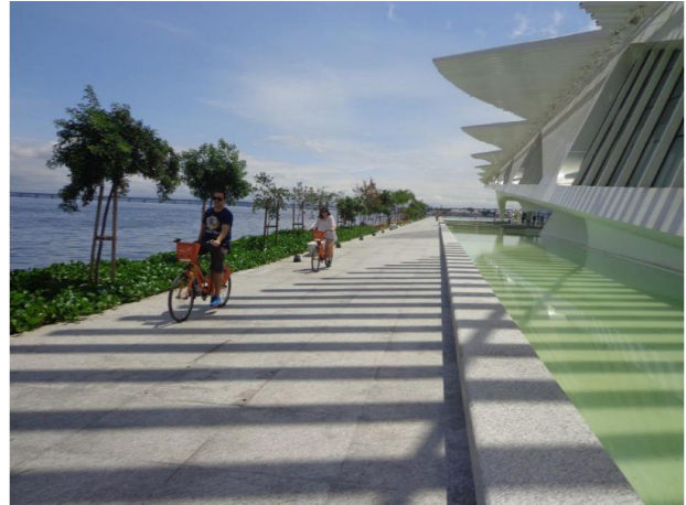
Figura 5 - Museu do Amanhã (vista do “parque”)

A redundância de adicionar mais água perto do mar aumenta a umidade do ar. O espelho d’água apresenta algumas sujidades que alteram a qualidade e a coloração da água, cuja evaporação deve contribuir para acelerar a oxidação da estrutura metálica (Figura 6). Com o tempo, a poluição e as chuvas, o visual será previsivelmente diferente. Com menos de dois meses de operação, a brancura da estrutura metálica já apresenta sinais de poluição do ar e de corrosão. Uma falha nos dispositivos de segurança do sistema elétrico durante a construção provocou a morte de um operário – eletrocutado com a energização de uma estrutura metálica – e resultou no embargo das obras pelo Ministério do Trabalho e Emprego (ARCOweb, 2015).