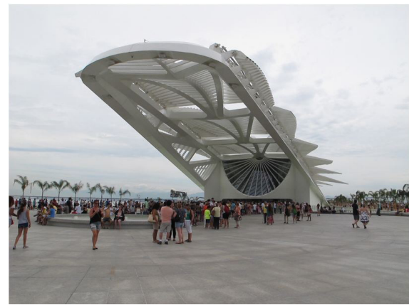
Figura 2 - Museu do Amanhã (vista externa)