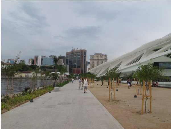
Figura 9 - Vista do Mosteiro de São Bento e das “Verrugas Urbanas”

qualificar uma paisagem que segue maravilhosa apesar dos grandes e dispendiosos esforços em contrário (Rheingantz, 2015).