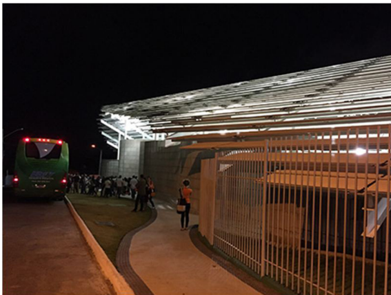
Figura 1 - Arena do Morro (vista externa noturna)

Para dar conta das conexões que configuram dois lugares em ação – Arena no Morro (Figura 1) e Museu do Amanhã (Figura 2) –, são exploradas