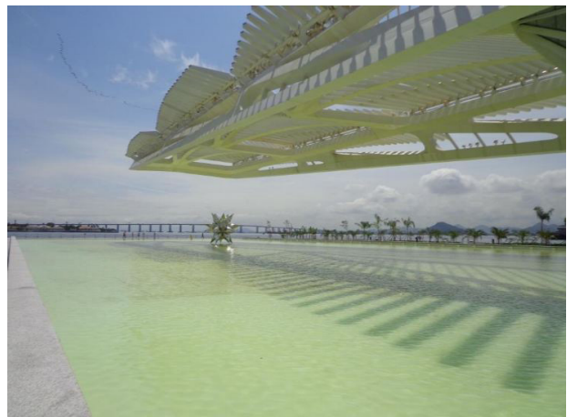
Figura 6 - Museu do Amanhã (vista do lago, com a Baía da Guanabara ao fundo)

Um dos autores deste artigo relata assim sua primeira visita à Praça Mauá e ao Museu do Amanhã: