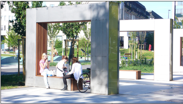
Figura 2 - Os portais multimídia instalados no Parque Severni Mestni (Ljubljana, na Eslovênia) possibilitam a leitura e a escuta de clássicos da literatura internacional na linguagem original. Portais USB e caixas de som instaladas permitem também escutar músicas próprias com volume limitado Fonte: In.Ka.Bi (2012).

informação àqueles mais diretamente envolvidos com a produção dos espaços públicos. Assim, os dispositivos de GPS ou SIG também ajudam a melhor interpretar e compreender as relações entre utilizadores e espaço.