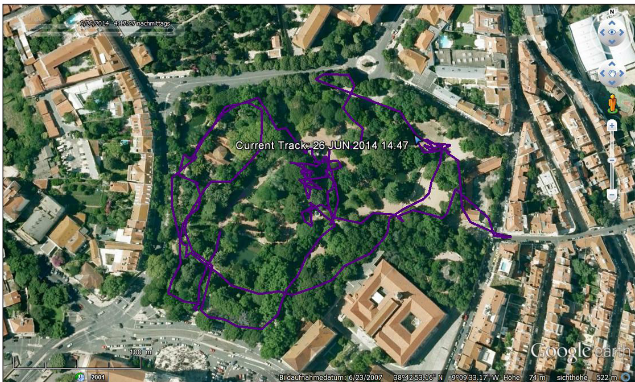
Figura 5 - A representação típica de um itinerário no Jardim da Estrela (Lisboa, em Portugal), com o trajeto e os pontos. Para cada ponto, além das coordenadas, foi registrado o tempo em que foi alcançado Fonte: CyberParks (2015).

Um importante aspecto das tecnologias digitais é possibilitar o diálogo entre espaços e usuários, bem como entre usuários e aqueles que se interessam pela produção dos espaços públicos. Em Lisboa (Portugal), desenvolver esse diálogo é um ponto central do projeto. Dois testes iniciais, e em dois diferentes parques da cidade, Jardim da Estrela e Parque da Quinta das Conchas (ver Smaniotto Costa, 2012), foram realizados em junho de 2014 e 2015. Os testes foram acompanhados de um questionário, e em cada parque recorreu-se a um dispositivo diferente. No Jardim da Estrela, um parque implementado no fim do século XVIII e inserido no coração histórico da cidade, foram usados dispositivos de GPS com o objetivo de rastrear o itinerário de visitantes (Figura 5). O aplicativo WAY CyberParks foi utilizado no Parque da Quinta das Conchas, um parque instalado em 2005 no remanescente de uma quinta e agora inserido em uma área de adensamento e de expansão urbana. Os resultados da análise, ainda que preliminares, estão discutidos em Smaniotto Costa et al. (2014),