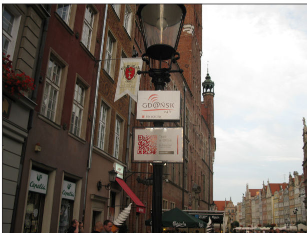
Figura 1 - Para o campeonato europeu de futebol de 2012, as cidades-sede da Polônia instalaram vários hotspots para acesso gratuito à internet em espaços públicos. Placas sinalizadoras indicavam as áreas de cobertura, como na cidade de Gdansk, onde, por meio dos códigos QR, obtinha-se informação turística sobre esses lugares.

A oferta de serviço wi-fi em espaço público também tem contribuído para o surgimento de novos tipos de mobiliário urbano, projetados para facilitar o uso da rede wi-fi , como em painéis informativos sobre a disponibilidade de rede a novos tipos de mobiliário, que é o caso dos BLOCPARC instalados em Paris (França). Nesse contexto, a capital francesa testa, atualmente, seis diferentes tipos de mobiliário urbano inteligentes, entre eles o Porto Digital ( Digital Harbour ), uma espécie de quiosque aberto com um telhado verde, com mesas e assentos giratórios projetados para o uso de computadores portáteis, oferecendo acesso gratuito ao wi-fi e a pontos de recarga de dispositivos eletrônicos (Blocparc, 2015).