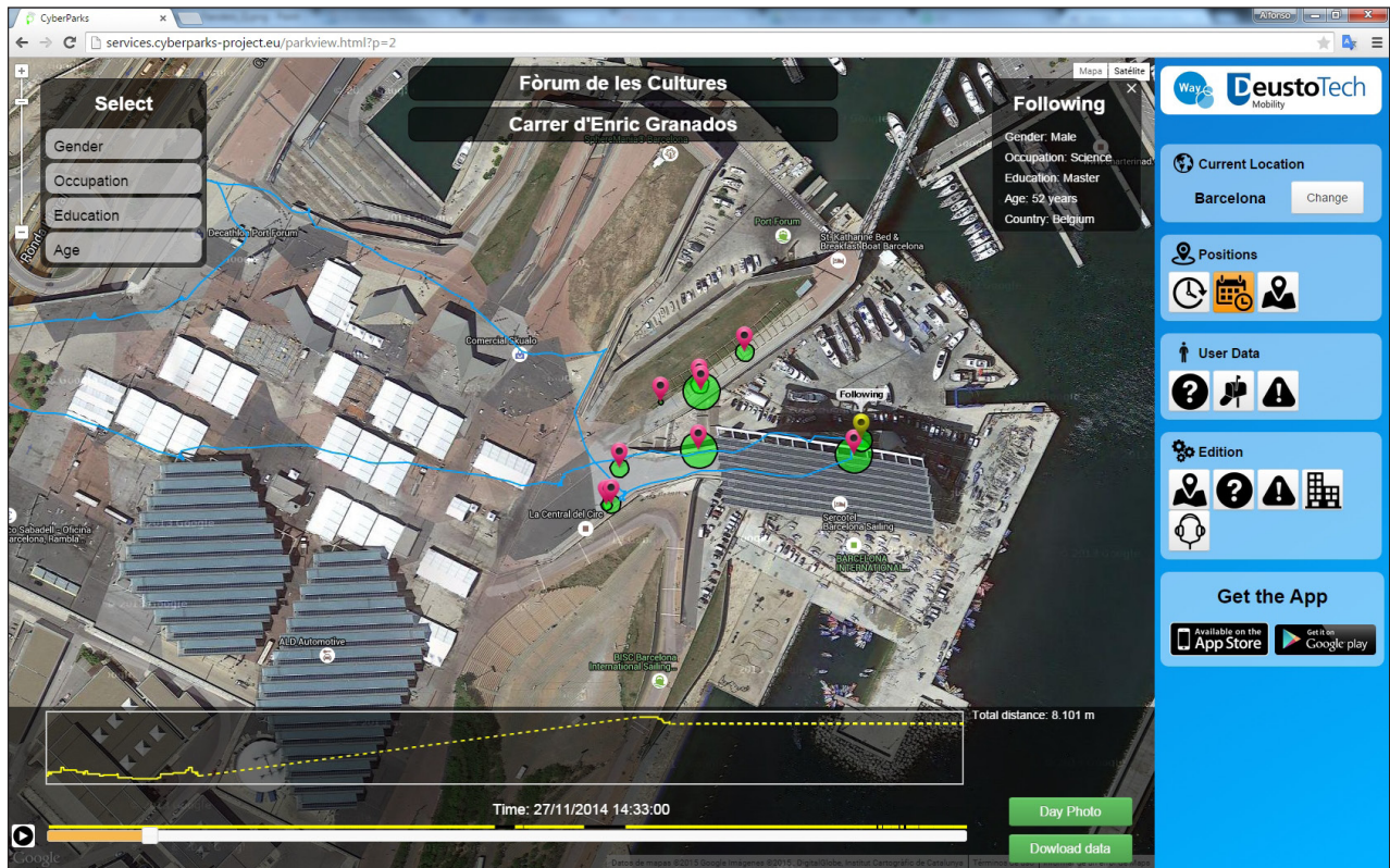
Figura 3 - Imagem do serviço web do aplicativo WAY CyberParks mostrando o itinerário de um usuário no “Fòrum de les Cultures”, em Barcelona (Espanha). Os círculos verdes indicam a incidência de usuários