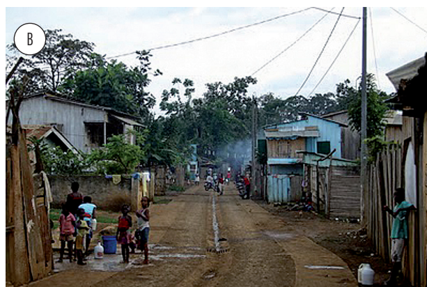
Figura 6 - Casas no bairro na periferia da cidade feitas de madeira

Essas zonas são ocupadas pelas populações do interior da ilha, que, por razões económicas ou mesmo sociais, decidem ocupar um território fora do centro urbano, mas com alguma proximidade em relação a este. Aqui cada indivíduo é o responsável pelas intervenções estruturais, habitacionais, viárias e sanitárias da sua própria casa, sem qualquer preocupação em relação ao espaço urbano coletivo. Apesar de esse tipo de estrutura não ter sido planeada, reconhece-se no parcelamento dos bairros uma hierarquia de vias estruturadas a partir dos caminhos principais de acesso ao centro urbano. Apesar de não serem loteados, no sentido tradicional do termo, reconhece-se neles uma hierarquia de caminhos de acesso às habitações a partir das vias principais de acesso aos bairros (Figura 7).