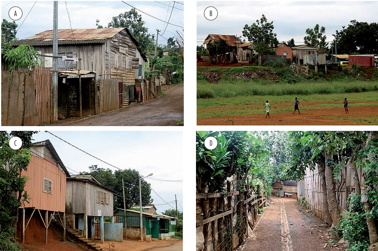
Figura 7 - Bairro do Riboque nas margens da zona central da cidade de São Tomé

caminhos de peões que dá acesso às casas é constituída por caminhos de pé posto (de terra batida), bastante estreitos, degradados pela erosão e muitas vezes estrangulados por outras construções ou pelos seus quintais.