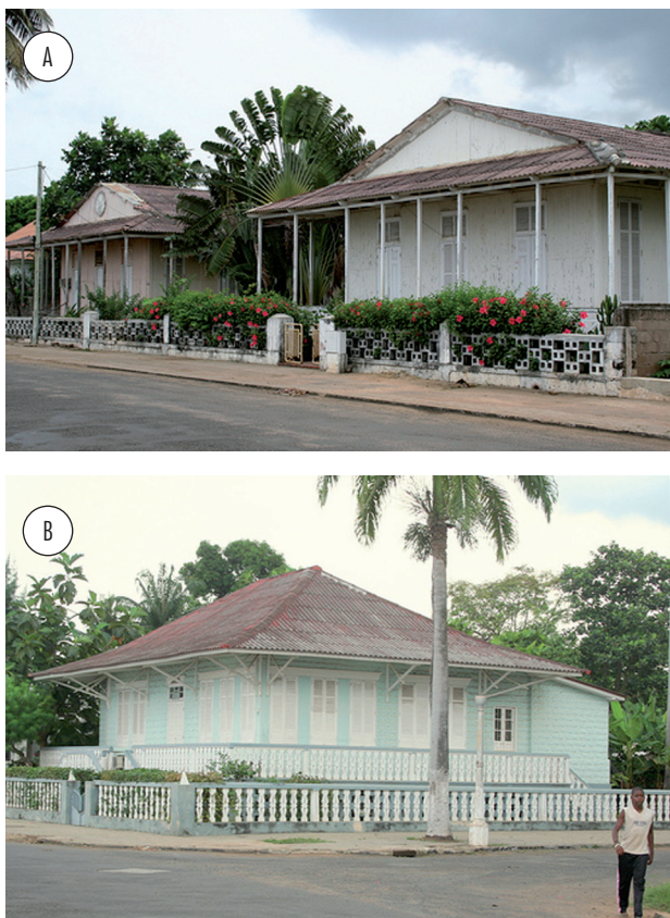
Figura 4 - Casas coloniais de planta quadrangular, construídas no período pré-independência