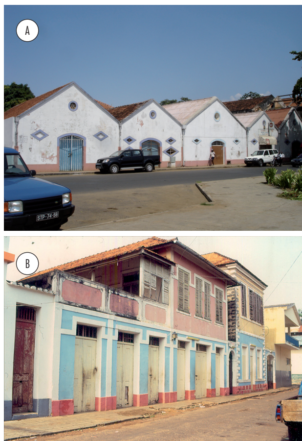
Figura 1 - Conjunto de quarteirões situados na actual baixa da cidade de São Tomé, construídos no período colonial

A esse traçado corresponde a primeira fase de desenvolvimento urbano, iniciada com a chegada dos primeiros colonos e essencialmente marcada pela existência de dois núcleos urbanos e uma rua principal que os liga. Essa fase, comum a outras cidades atlânticas de origem portuguesa (como o Funchal, Angra ou Ribeira Grande), é caracterizada pelo crescimento do tipo linear (paralelo ou perpendicular à costa, consoante os casos) ao longo do desenvolvimento da referida rua.