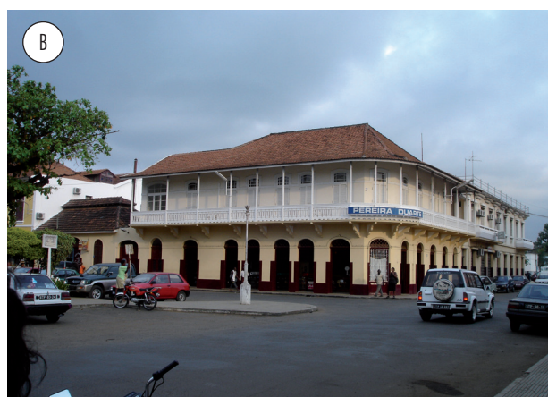
Figura 3 - Conjunto de quarteirões situados na atual baixa da cidade de São Tomé, construídos no período colonial. Fonte: NEVES, 1989. Fonte: Isabel Godinho, 2009.

Avenida Eng. Rebelo de Andrade, e alguns exemplares, também recuperados, junto à marginal.