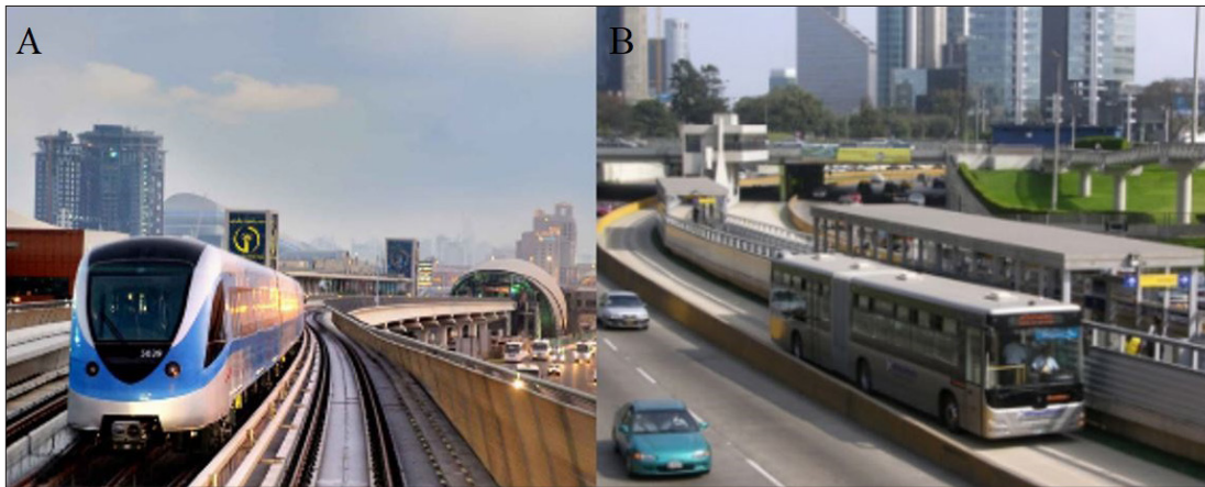
Figura 5 - Fundamentos dos transportes públicos propostos pelo IPGUL (2015) (A): Dubai Metro; (B): Sistema totalmente segregado de BRT em Lima.

maneira de imitar ou traduzir o original que nunca se completa ou se conclui em si mesma. Entende-se, de acordo com Moscovici (2009), que representação social é o processo pelo qual se estabelece a relação entre o mundo e as coisas. Logo, ao se importar modelos sem considerar o contexto concreto onde estão situadas as pessoas, grupos, expressões culturais e de objetos, se abdica da própria condição da realidade social a serviço dos modelos de enquadramento de realidades.