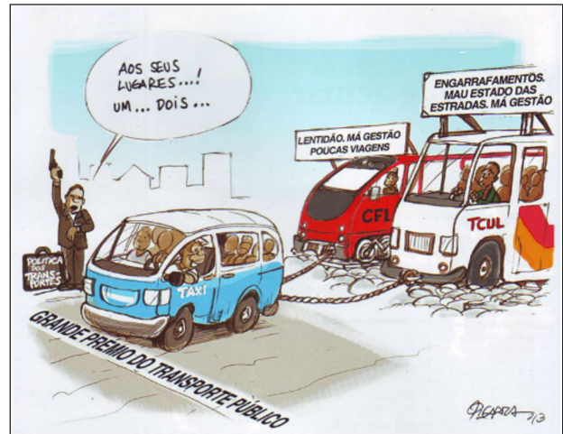
Figura 2 - Para-transit in Luanda — A atual política dos transportes urbanos de Luanda