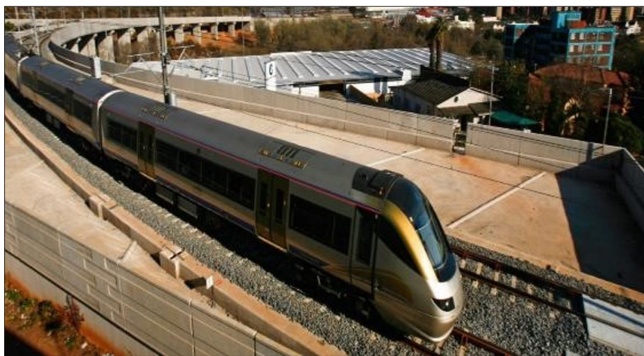
Figura 4 - Fundamentos dos transportes públicos propostos pelo IPGUL (2015)

A esse comportamento meramente copista Bhabha (1990) chamou de “traduções nocivas”, pois é uma