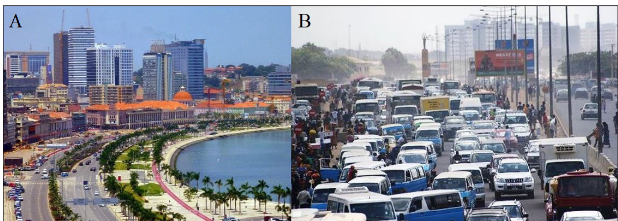
Figura 6 - (A) Orla marítima – a “baía de Luanda”; (B) Trânsito de candongueiros

Ao contrário da linda baía, na orla da marginal marítima da cidade baixa (Região Central – Figuras 6), cartão postal oficial que o poder político-econômico