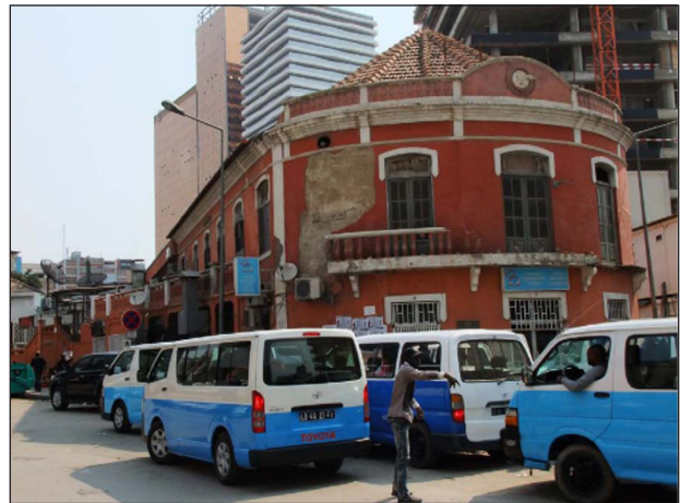
Figura 3 - Representação dos candongueiros na região central de Luanda

urbana se não for acessível – por meio do deslocamento diário de pessoas”. Em qualquer lugar, as sociedades procuram formas diversas de se relacionarem a partir de deslocamentos constantes. As formas e modalidades da mobilidade diferem de lugar para lugar e cada um, à sua própria lógica, cumpre a finalidade a que esse nexos se propõe.