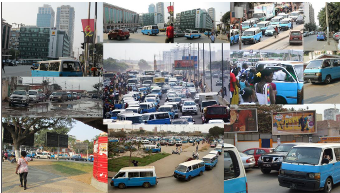
Figura 7 - Presença dos candongueiros na cidade (paisagem urbana de Luanda)